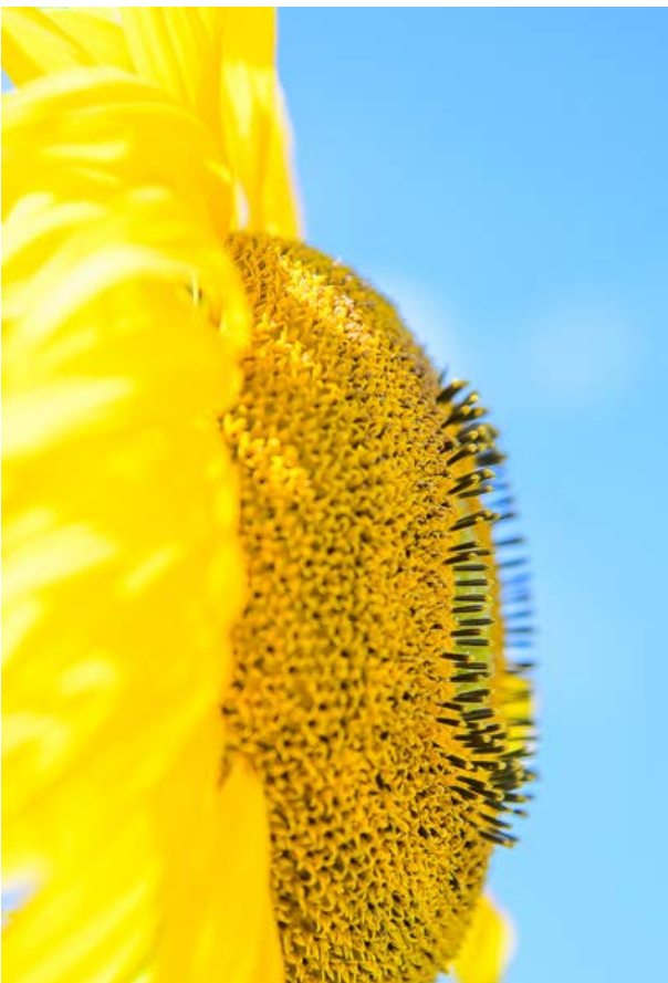
Trau dich, dein Motiv anzuschneiden!