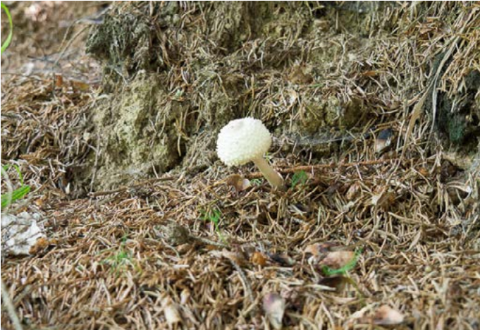
Hier ist zu viel am Bild. Der Pilz, der das Hauptmotiv ist, kommt nicht zur Geltung.

Probiere beim Gestalten immer so wenig wie möglich und soviel wie nötig auf deine Fotos zu nehmen, um deine Botschaft zu vermitteln.