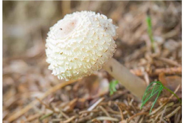
Wenn du alles Überflüssige weglässt, steht dein Motiv im Mittelpunkt.